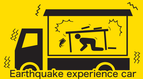
Earthquake experience car

Public Interest Incorporated Association, MatsusakaJunior Chamber Open Regular Meeting in February 2017